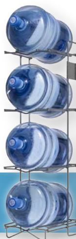
Flaschenregal Edelstahl für 4 Flaschen